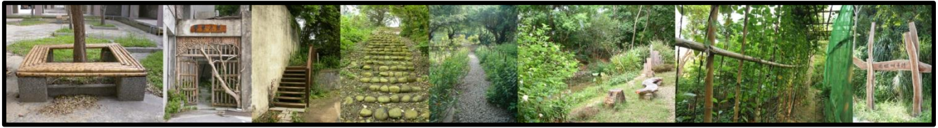
榆園、蘭花小徑、木樓梯、哲學家步道、斑蝶小徑、慈塘、網室、路牌。