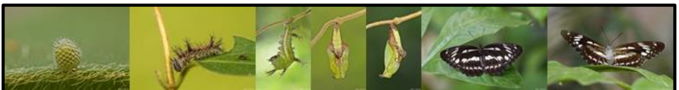
台灣星三線蝶的卵、二齡蟲、前蛹、蛹（背面和側面）、成蝶（背面和腹面）。

2010~2012 年的主要工作內容包括：確立本網站的「主要原則」、建立組員之標準工作流程、確立網站主要架構、新增分頁功能、建立蝴蝶網路圖鑑。蝴蝶圖鑑已經大致完成，可望於 2013 年釋放。2013 年起的工作目標包括「圖文關鍵詞搜尋功能」和「養蝶植物網路圖鑑」。