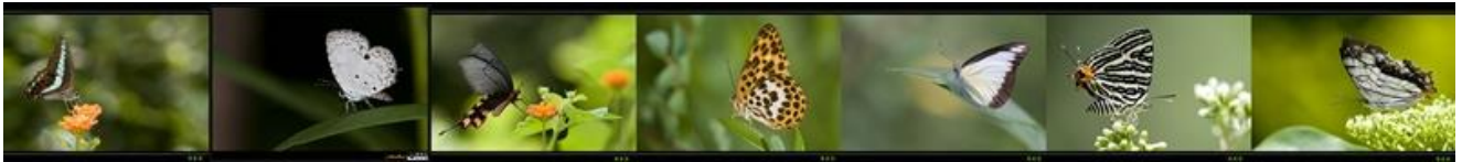
青帶鳳蝶、台灣黑星小灰蝶、台灣麝香鳳蝶、豹紋蝶、台灣粉蝶、台灣雙尾燕蝶、石牆蝶。