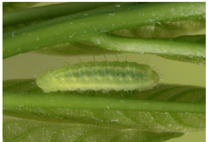
圖 9. 三齡蟲