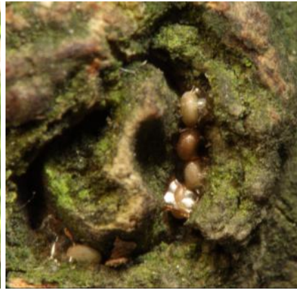
圖 5. 卵聚產於樹皮縫隙中