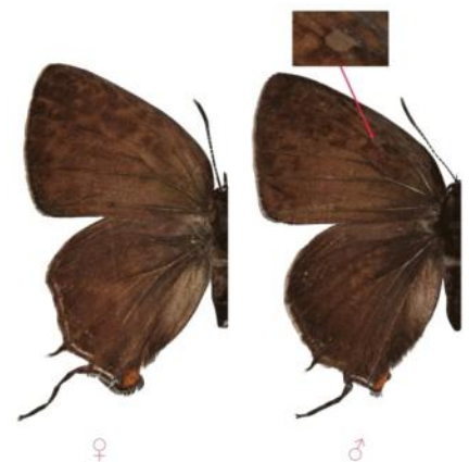
圖 3. 雄蝶翅背中室內有一個白褐色橢圓斑（性徵）