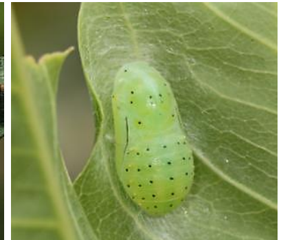
圖 13. 寄主葉背上的蛹

飼育要點 台灣灑灰蝶在中國大陸被當成無患子樹的農業害蟲，在蟲害防治上有多種藥劑防治試驗成果發表。本種由卵孵化成幼蟲至化蛹羽化，發育過程不到一個月，飼育時照顧期短。