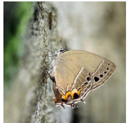
圖 2. 雌蝶在無患子樹樹幹上產卵

卵初產時呈白色泛藍色光澤的頂部凹陷半球形，不久轉呈灰白色，中央凹陷爲精孔，表面密佈網目狀凹紋，大小爲直徑0.65mm /高0.35mm。