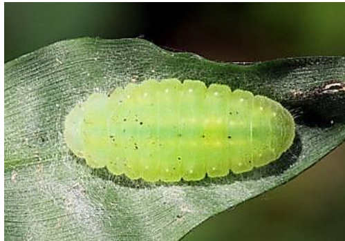
圖 12. 寄主附近植物葉下的前蛹