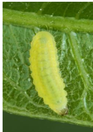
圖 8. 二齡蟲