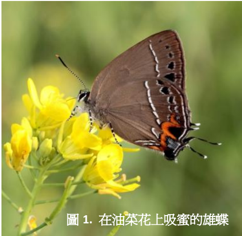
圖 1. 在油菜花上吸蜜的雄蝶