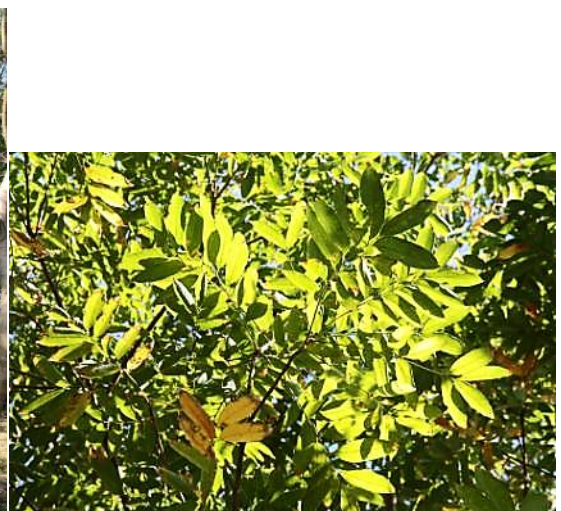
圖 15. 台灣灑灰蝶的寄主植物—無患子