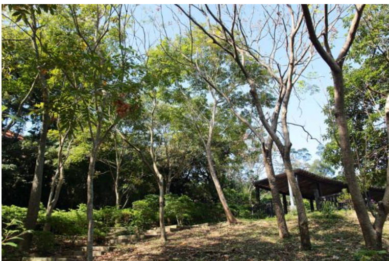
圖 14. 公園裡栽植的無患子就有本種棲息繁衍