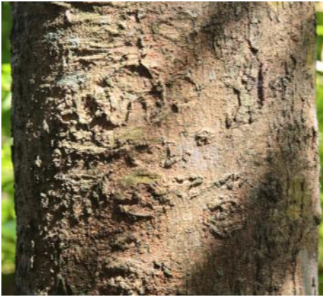
圖 4. 雌蝶會把卵產在無患子樹皮縫隙中，若不注意，難以發現。