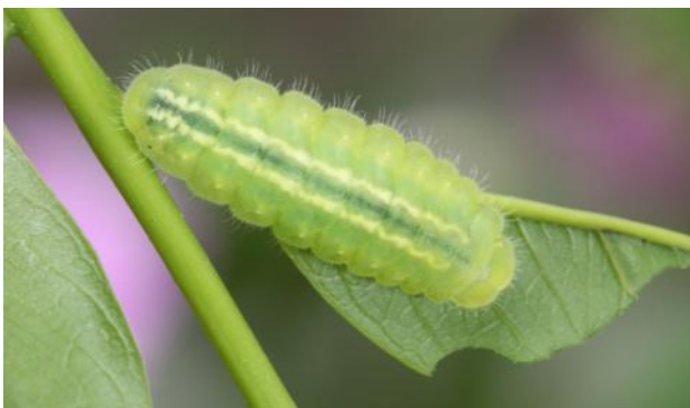
圖 10. 四（終）齡蟲

習性 本種一年一世代發生，雌蝶每年會在5、6月間產卵，以卵態越冬，卵於翌年3、4月間孵化，幼蟲通常在4月中旬開始化蛹，成蝶在4月下旬陸續羽化。卵期9~10個月，幼蟲期約16天，蛹期7~9天，一般成蝶正常壽命超過1個月。