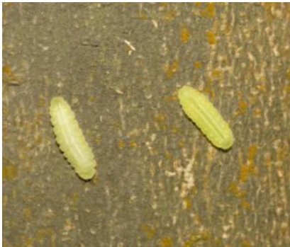
圖 11. 幼蟲化蛹前會往寄主樹幹基部移動

芽後孵化，若齡幼蟲就會移棲於新芽或嫩葉上，老熟幼蟲則多棲息在寄主新葉背面的中肋附近，啃食的葉片食痕多呈孔洞狀。老熟幼蟲在化蛹前，會往寄主樹幹底下較暗蔽處移動，並在鄰近的樹幹、牆垣或植物葉下化蛹，也有些會直接化蛹在寄主葉背上。