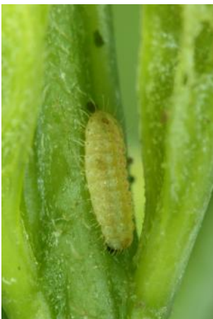
圖 7. 一齡蟲

蛹為淡藍綠色帶蛹，外型膠囊模樣，氣門白色，各體節背側有縱列的黑點，蛹體長約12mm。